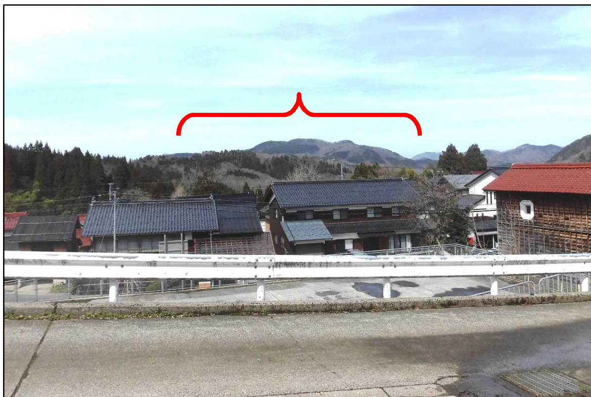
上段：兵庫県美方郡新温泉町 清正公園付近より撮影 下段：同 春來地区付近より撮影