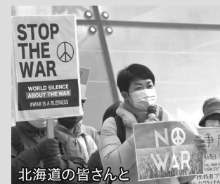
北海道の皆さんと