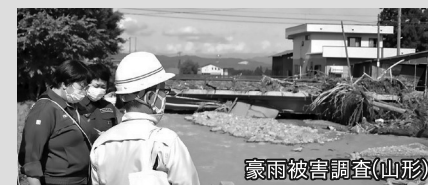
豪雨被害調査(山形)