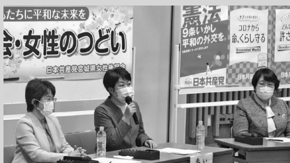
女性をつとめ (宮城)

長年の運動と世論の力とともに、岸田首相が義務付けの方針を表明するところまで前進しました。