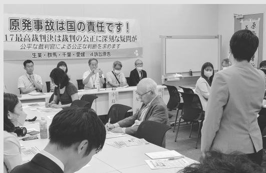
最高裁判決1年の集会(国会)

「原発事故を忘れたのか」——福島、全国で上がる怒りの声を示し、岸田首相、西村経産相、東京電力の責任を厳しく追及。