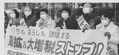
初売り宣言(仙台) (高橋千鶴子衆院議員らと)