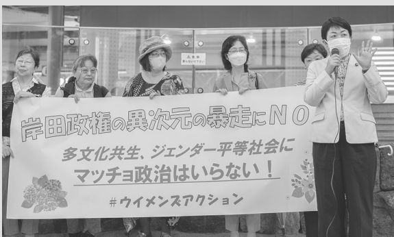
ウイメンズアクション(有楽町)

ジェンダーギャップ指数は146カ国中125位で過去最低。各団体の皆さんや超党派の議員連盟でジェンダーギャップ解消目指します。