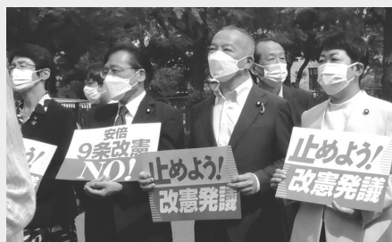
9条改憲、改憲発議NO! (国会前)