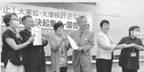
全国業者婦人決起集会(国会)