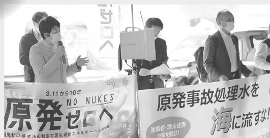
原発ゼロ・イレブン行動(新宿)