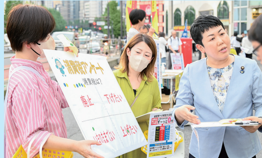
消費税廃止各界連絡会の宣伝(新宿)