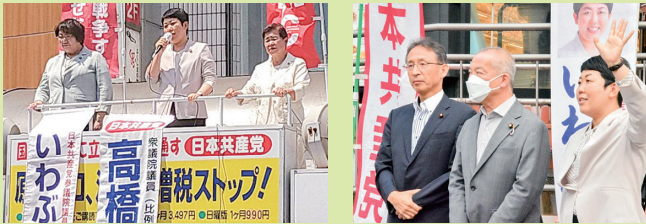
高橋千鶴子衆院議員と(福島)