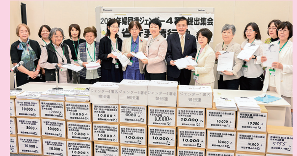
ジェンダー平等実現4署名提出集会(国会内)

日本婦人団体連合会の、ジェンダー平等実現に向けた請願署名の提出集会に参加。憲法と女性差別撤廃条約に基づく、平和・ジェンダー平等社会の実現のために力を合わせます。