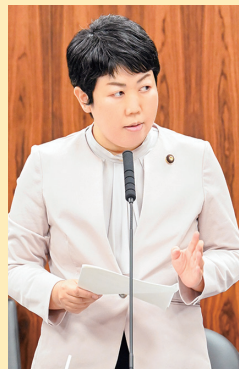
経済産業大臣を追及

大企業や富裕層・大株主を大もうけさせる一方で、働く国民の暮らしを痛めつけ、日本経済を冷え込ませた自民党政治。