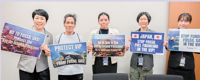
フィリピンの漁業者、国際環境NGOと